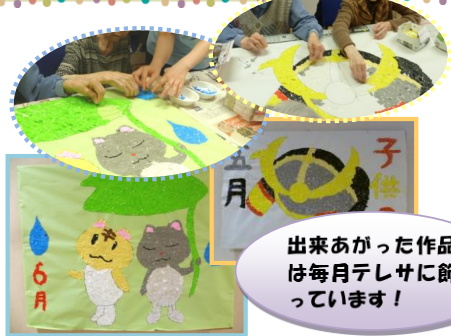
出来あがった作品は毎月テレサに飾っています!

週5日間、利用者様と簡単な脳のトレーニングを行っています。また、季節を感じられるちぎり絵、貼り絵の作品作りにも取り組んでいます。 集中力、生活リズム、自信 (やる気)、を身につけて頂き認知症の 周辺症状の軽減 に努めます。