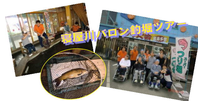
寝屋川バロン釣り堀ツアー

六月十三日 ボウルバロンに隣接する釣り堀に男性陣が行きました。 大きな釣り堀りに糸を垂らすと次々と魚を釣り上げておられました。中には五十センチを超える大物を釣る人も・・・ 皆さん童心に返って楽しんでおられました。