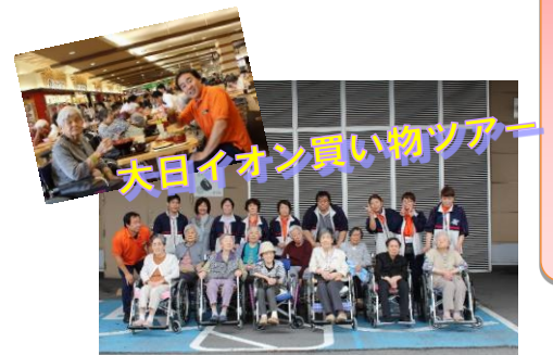
天日イオン買い物ツアー