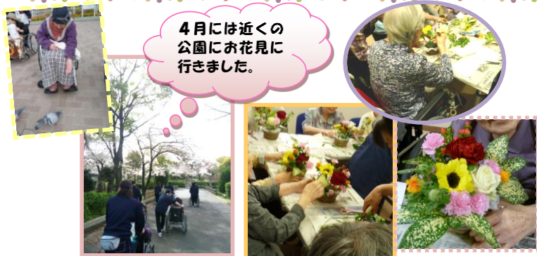
4月には近くの公園にお花見に行きました。

母の日には、毎年恒例のフラワーアレンジメントを行いました。花屋さんに来てもらい利用者様も一緒に色とりどりに季節のお花を飾り、「綺麗ね」と笑顔が見られ、喜んで頂けました。